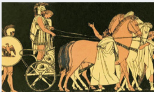
図2 愛妾としたカッサンドラとともに凱旋するアガメムノン

もなかったのだ。 前夫の弟アイギストスとともに に練り上げられた暗殺の計画は、 ただちに実行された。アガメム ノンは無防備で湯浴みをしてい る最中に投網で動きを封じられ て切り殺された(図3)。愛妾と して連れてこられたトロイア王 女カッサンドラも殺された。