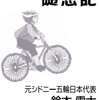
元JDF一五輪日本代表 鈴木 雷太