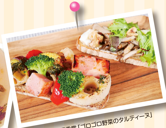
第2回最優秀賞「ゴロゴロ野菜のタルティーンヌ」