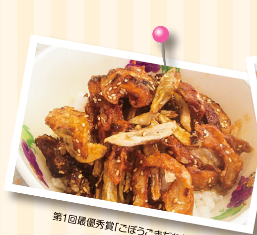
第1回最優秀賞「ごぼうごまだれ丼」

松本歯科大学では、「よく噛んでおいしく健康に」をテーマに、塩尻市、松本市の飲食店や市民の皆様呼びかけて、「カムカム(噛む噛む)メニュー」の普及を推進しています。カムカムメニューとは、食材や調理法を工夫し、食感や噛み応えがあり、食べた人が自然と噛むことを意識して食への関心を高める献立です。