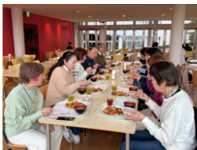
カムカムメニューを味わう県シニア大学生

長野県シニア大学松本学部2025年度1年生(第48期生)「A5班」の8人が3月26日(木)、月1回の「カムカムメニュー」提供日に合わせて本学カフェテリアを訪れた。