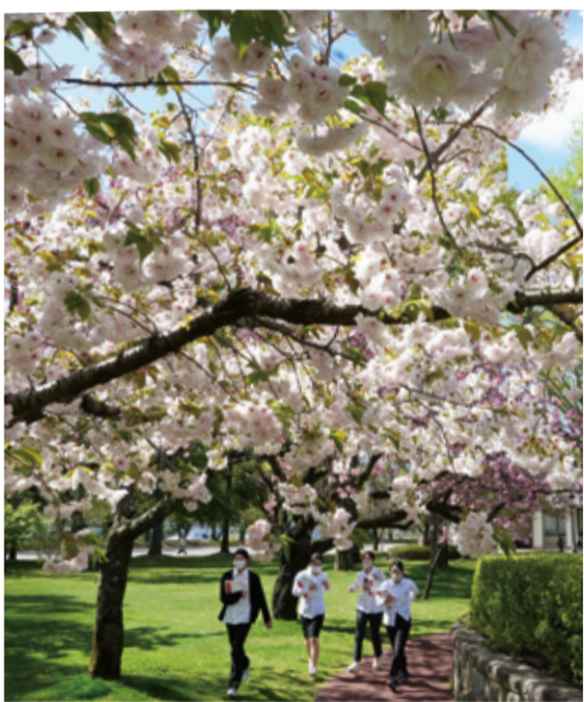
八重桜の下を歩くと教室に向かう衛生学院生

キャンパス内にある八重桜は今季例年より開花が早まって4月中旬から徐々に見ごろに入り、教室の移動で行き交う学生や教員、近隣から見物に訪れる人など、たくさんの人の目を惹きつけている。 キャンパス内には約1000本の桜があり、最も多いソメイヨシノは今季、4月9日（木）の歯学部・大学院・衛生学院の入学式に合わせて満開を迎えた。八重桜はその後を追って咲き、ソメイヨシノと比べると数こそ少ないが、一つ一つの豪華さは格別で、個性を際立たせながら、ふっくらとした花を風に揺らしている。 色の「御衣黄」「鬱金」、垂れ下がって咲く淡紅色の「二葉」など、中庭、病院エントランス前、病院北側を中心にさまざまな品種が見られ、大学関係者だけでなく、地域の大勢の人も訪れ、年に一度の美しい季節を楽しんでいる。桜を見ながらの散歩や写真撮影、中にはピクニックを楽しむ人の姿も見られ「この桜は最高」「きれいに手入れをされてこの桜は幸せだ」などと話し、春のどかなひとときを満喫していた。 八重桜は天候にもよるが、一部の種類は5月初旬まで楽しめる。