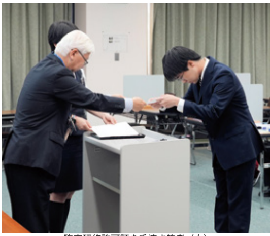
臨床研修許可証を手渡す筆者(左)

4月1日(水)、本学図書館学生ホールにて、第119回歯科医師国家試験に合格した新入歯科医師の先生方を中心とした、松本歯科大学病院の歯科医師臨床研修が開始された。