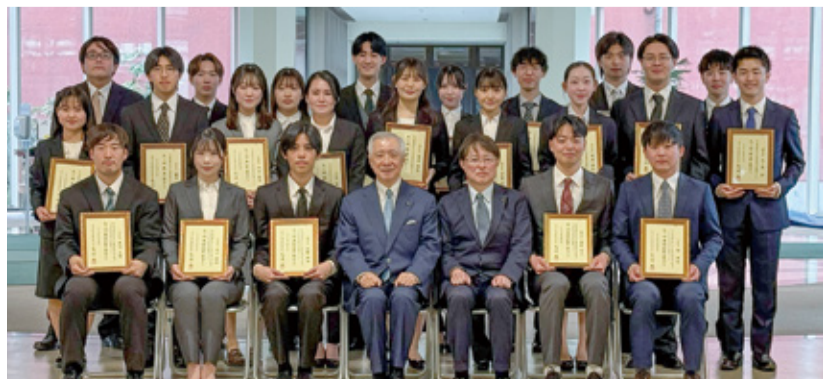
矢ヶ崎理事長（前列中央）、宇田川学長（前列右から3人目）と賞状を手にする受賞学生