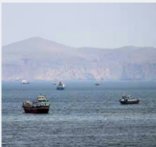
封鎖が続くホルムズ海峡

私がこの原稿の仕上げに取りかかっている4月中旬は、パキスタンの仲介で行われた米国とイランの戦闘終結に向けた直接協議が決裂したところだ。米国からはヴァンス副大統領が出席、1979年のイラン革命で断交した後、最上級の高官による対面協議となったが、日付をまたぐ21時間におよぶ会議は合意に至らなかった。