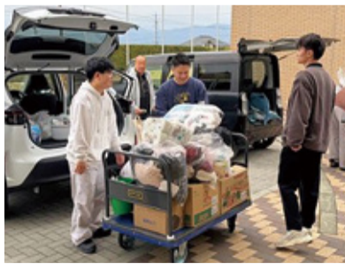
荷物の運搬をするサポート隊

第2学年の有志15人は、「新入生サポート隊」として4月4日(土)・5日(日)の2日間、学生寮「キャンパスイン」に入寮する新入生の引っ越しを支援した。