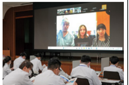
オンラインで行われたプレゼンテーション

松本歯科大学病院臨床研修において4月23日（木）、本学病院と連携を組んでいる臨床研修