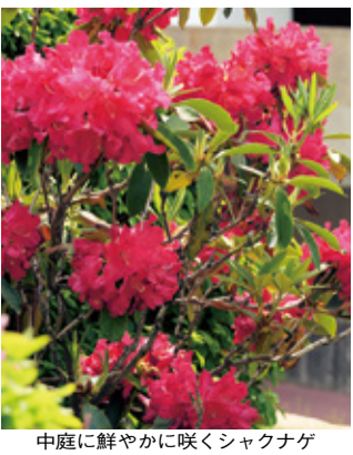
中庭に鮮やかに咲くシヤクナゲ

季節ごとにさまざまな花木が楽しめる本学キャンパスでは例年5月から6月にかけて、シヤクナゲの花が見ごろを迎える。今季も本館玄関前や中庭などで、ピンクや赤のふっくらとした大輪の花を咲かせ、行き交う人の目を惹きつけている。シヤクナゲは「花木の女王」ともいわれ、5月の大型連休以降、日当たりのよい場所にある木から徐々に咲き始めた。大