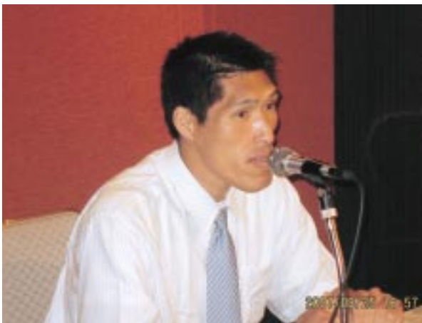
シドニーオリンピック銀メダリストの篠原先生

に対する取り組み方、現在には後進の指導についてなど、それと、日本柔道連盟の選手に対する、練習から試合本番