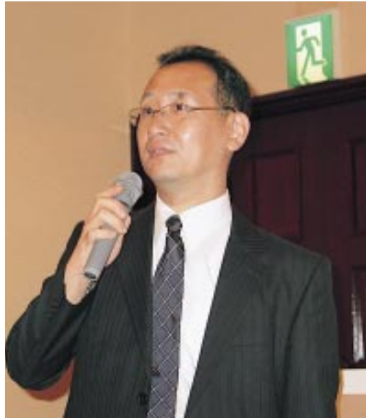
竹丸広島県支部長