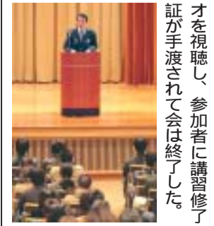
交通安全講習会の様子

四月二十日(木)、講堂において交通安全講習会が開かれ、歯学部、衛生学院の学生約五百六十人が参加し、交通安全に関する認識を新たにしました。