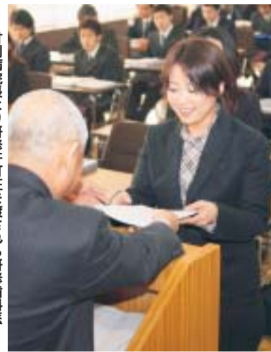
甘利院長より研修許可証を渡される研修歯科医

オリエンテーションの初日には、書会館学生ホールにおいて研修許可証交付式が行われ、国家試験を突破して喜びにあふれる研修歯科医一人ひとりに、甘利光治病院長が研修許可証を手渡した。